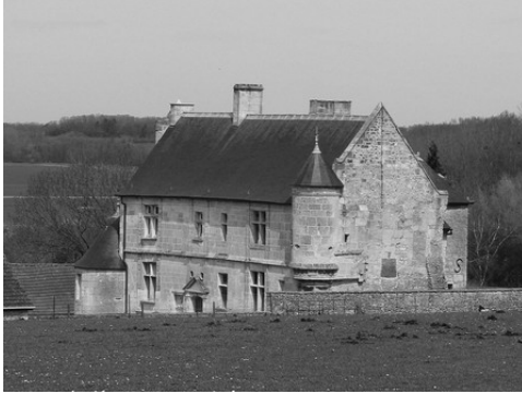
Le manoir vu depuis l'Ouest