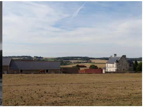
La vue vers l'Ouest avec le manoir