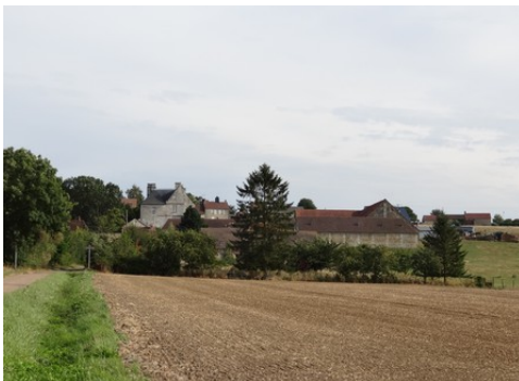
Le village et le manoir vus du Nord-Ouest

Les avis seront cohérents avec ceux émis ces dernières années, à savoir : pas de maisons à volume compliqué (type V, W, Y, ou Z), pentes à 45° pour les volumes principaux, ardoise ou tuile plate de teinte brun vieilli, à 20u/m², avec un débord de toiture de 20cm, enduit de teinte beige clair avec modénatures (au choix : chaînages, encadrement de fenêtres, soubassement, colombage...). *Voir les autres fiches.