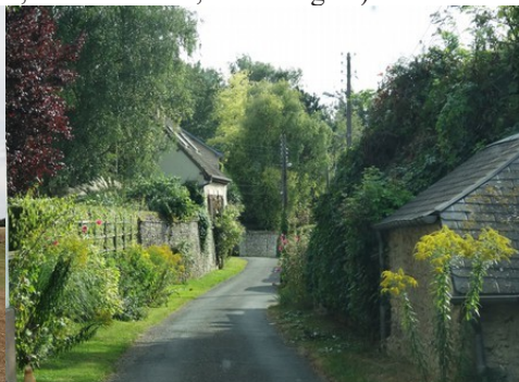
Une rue de Bus-Saint-Rémy