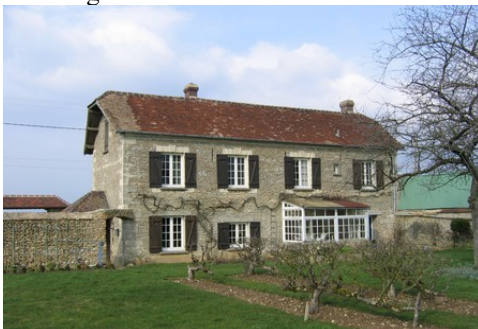
Un exemple de maison (moellons, tuiles)