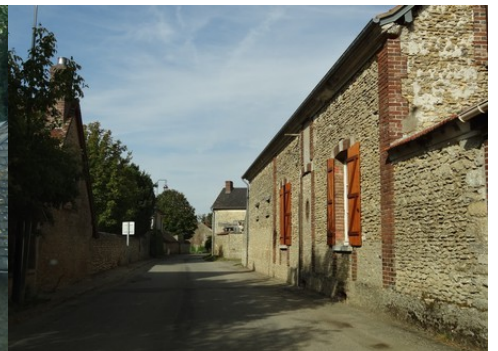
Le bâti rural avoisinant