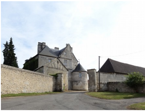
Le portail d'entrée du manoir