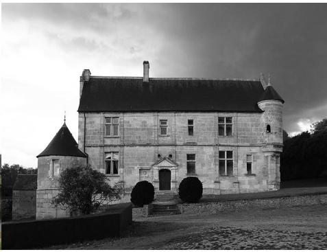
La façade sud-ouest du manoir