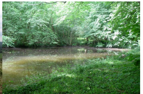
Les berges de l'Epte