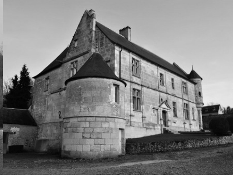
La tour basse à l'angle nord-est