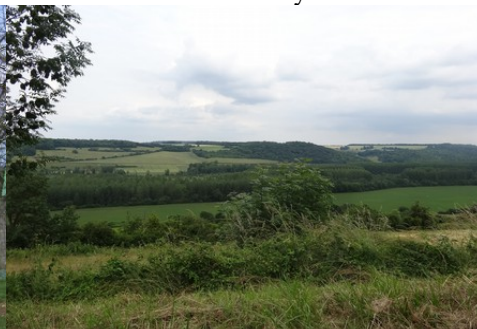
Le paysage autour de la vallée de l'Epte